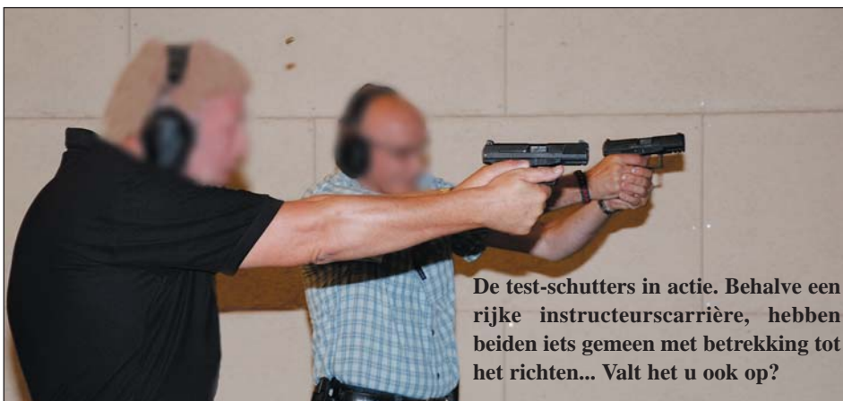
De test-schutters in actie. Behalve een rijke instructeurscarrière, hebben beiden iets gemeen met betrekking tot het richten... Valt het u ook op?

Rechtsonder: De RFID-chip bevindt zich in de rug van de greep en kan zo veel méér... Zie tekst.