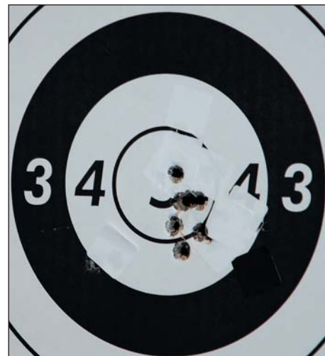
Een 10-meter snelvuurgroepje met P99Q-NL en Action NP munitie. Bijna ongekend voor een dienstpistool!

Er zijn sportschutters die graag het nationale politiepistool in hun privé-arsenaal willen opnemen. Helaas, dat gaat niet lukken. De P99Q-NL wordt specifiek voor de Nederlandse overheid gebouwd en wordt niet op de burgermarkt aangeboden. De van een randje voorziene kamer, bijvoorbeeld, is voorlopig 'nur für die Holländer'. Er zijn gelukkig andere 99-uitvoeringen die afgezien van de aanwezigheid van een ontspanknop er hetzelfde uitzien (Flikken Maastricht!) en aanvoelen en minstens even accuraat zijn, zo niet accurater omdat de Q-NL versie een typisch "straat-veilige" doch ietwat zware trekkingang heeft.