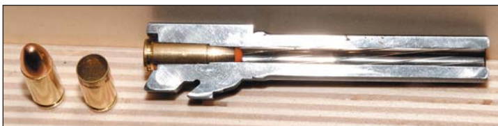
De doorsnede van de Q-NL loop toont de merkwaardige kamer.

Rechtsonder: De RFID-chip bevindt zich in de rug van de greep en kan zo veel méér... Zie tekst.