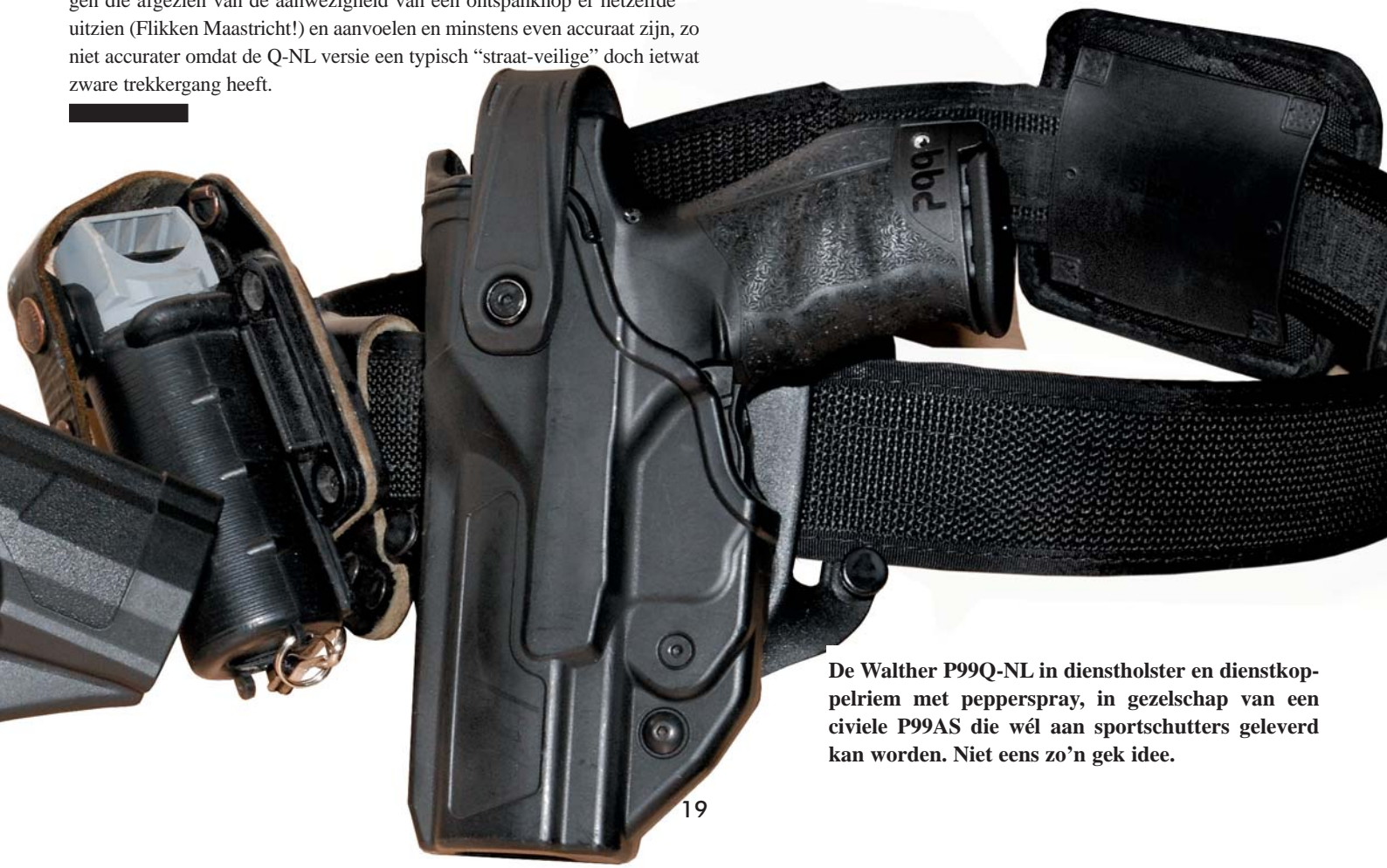
De Walther P99Q-NL in dienstholster en dienstkoppelriem met pepperspray, in gezelschap van een civiele P99AS die wél aan sportschutters geleverd kan worden. Niet eens zo'n gek idee.